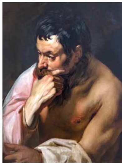
Le Penseur ou Faune en méditation, Jacob Jordaens (1593-1678)